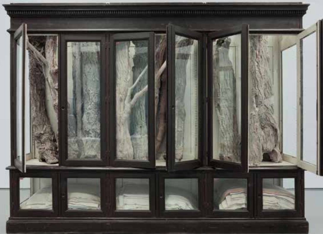
Berlinde De Bruyckere | 028, 2007 | Private collection Milan.