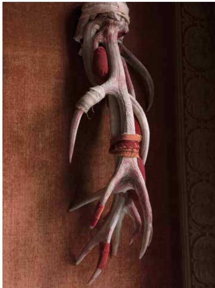
Berlinde De Bruyckere | Rodt, 6 Januari VIII, 2013 | Courtesy the artist, Hauser & Wirth, Galleria Continua | © Mirjam Devriendt