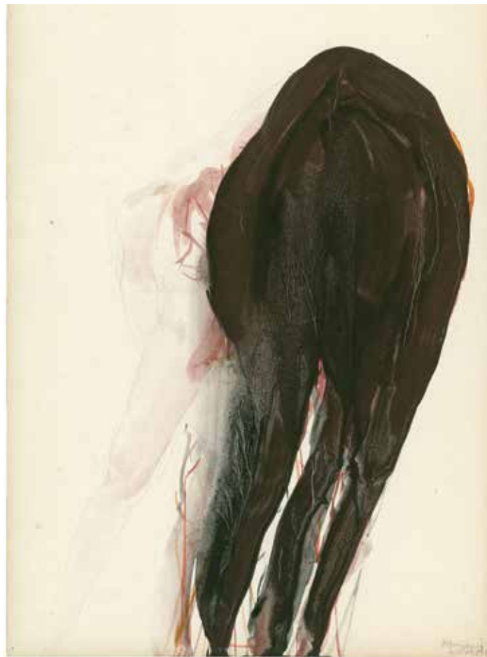
Berlinde De Bruyckere | Parasiet. 1997

Drawings are an essential part of this exhibition. They are hung in series in the same rooms as the sculptures, enriching them with their variations and nuances. Although De Bruyckere's three-dimensional work is better known than her drawings, the two disciplines go hand in hand in the development of her oeuvre. In her series of drawings, the artist above