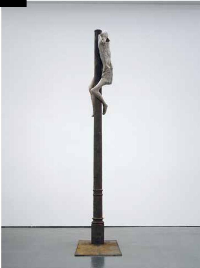
Berlinde De Bruyckere | Schmerzensmann I, 2006 | David Roberts Collection, London