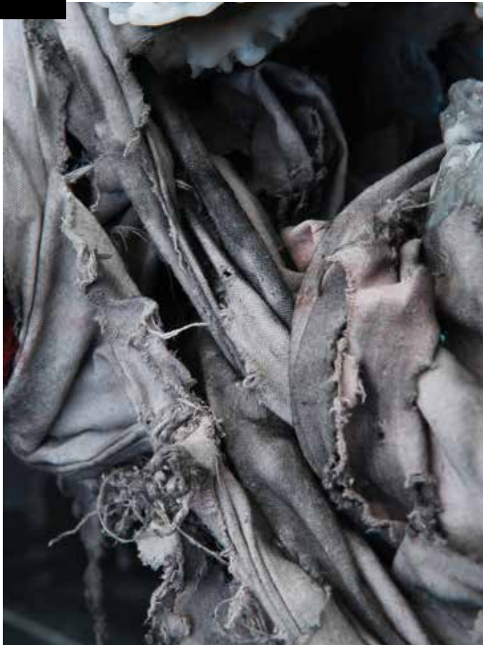
Berlinde De Bruyckere | Kreupelhout - Cripplewood (detail), 2012 - 2013 Courtesy the artist, Hauser & Wirth, Galleria Continua

disciplines vont de pair dans le développement de son œuvre. Dans les séries de dessins, l'artiste approfondit surtout des thèmes psychologiques et développe ses recherches plastiques. Pour ce faire, elle s'inspire, entre autres, d'études anatomiques et de dessins académiques d'après modèle. Les dessins de De Bruyckere deviennent souvent des esquisses pour des sculptures, mais ils ne sont pas pour autant des études préliminaires pour des œuvres spatiales. Chaque dessin évolue, existe et est considéré comme une œuvre à part entière. Comme dans un processus infini de croissance, de nouvelles œuvres semblent continuellement et organiquement renaître d'œuvres existantes chez De Bruyckere. Cette exposition est également conçue de manière évolutive: par le biais de la répétition de motifs clés à l'intérieur de combinaisons chaque fois différentes, on voit apparaître progressivement des parentés, des liens de contenu et de nouveaux niveaux de signification.