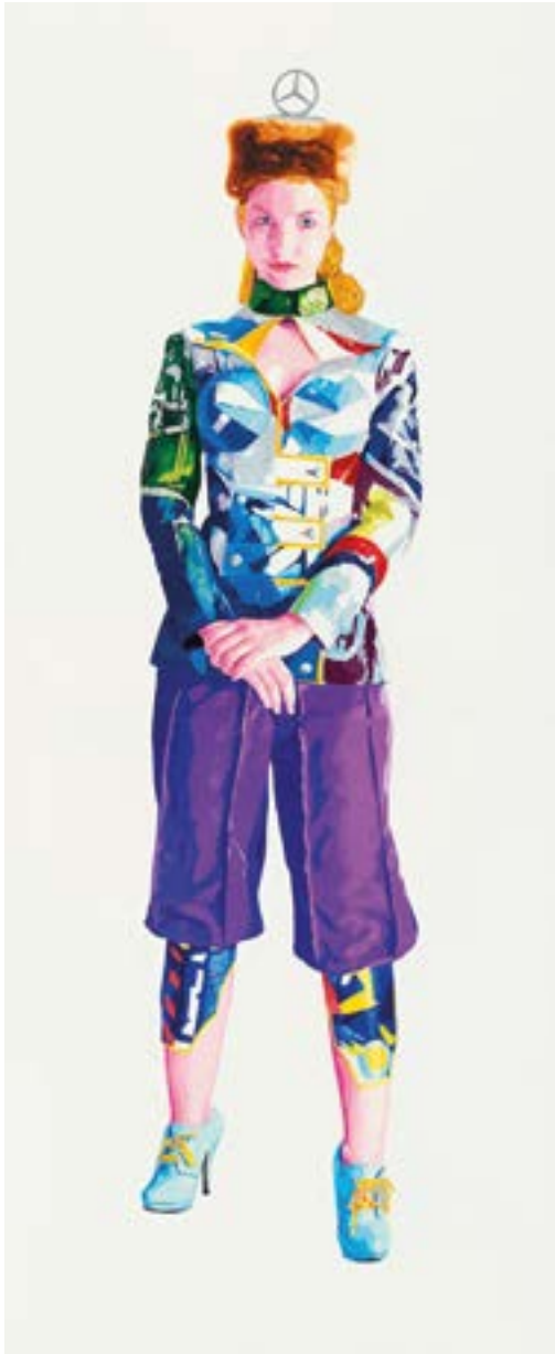
Abb. 11 General Bergfrühling 1