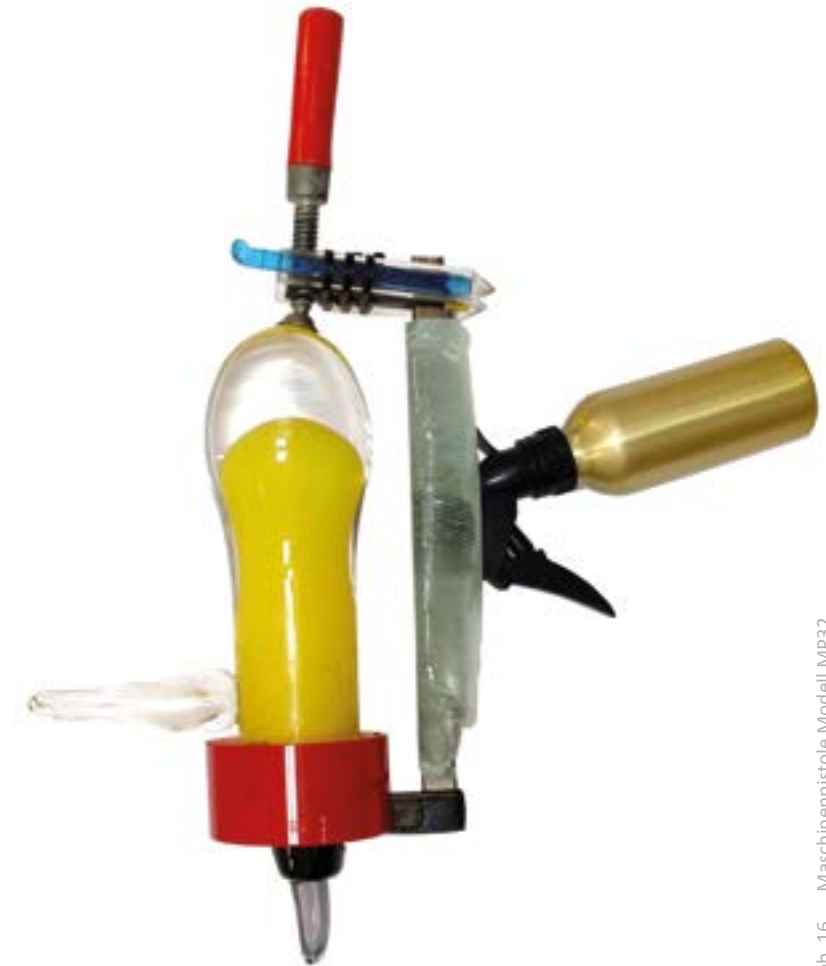
Abb. 16 Maschinenpistole Modell MP32

Im Kalibervergleich übertrifft die 4,6 mm x 30 Patrone die standardisierte 9 mm x 19 Patrone in Durchschlags- und Zielwirkung um ein Vielfaches. Zur Verdeutlichung: Das neue Hochleistungskaliber durchschlägt 1,6 mm Titan und 20 Lagen Kevlar noch auf 200 m.