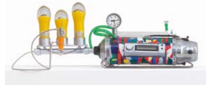
Abb. 9 „Herrscherinspirationsmaschine“