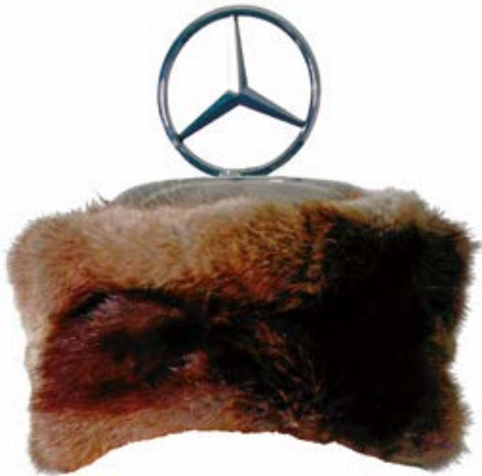
Abb.9 Beispiel für das Hoheitssymbol, Helm aus Silber mit bekröntem Hoheitszeichen und einem braunen Bärenfell