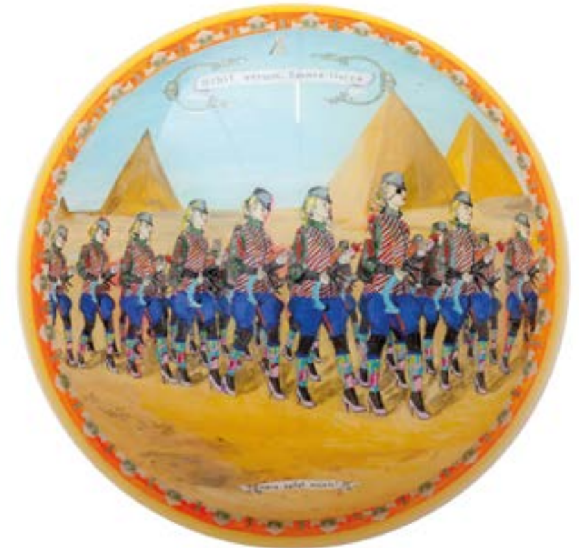
Abb. 13 Paradebild

Zu sehen ist eine Soldatenformation, die durch eine Wüste schreitet, vorbei an Pyramiden wie sie in Ägypten zu finden sind. Es wird angenommen, dass die Abbildung ein historisches Ereignis darstellt, welche die Geschichte der Besiedlung des neuen Kontinents veranschaulicht. Es stellt sich die Frage, ob sich unter dem Eis genau so riesige Pyramiden befinden wie in Ägypten? Sollte dies der Fall sein, muss gefragt werden, von welcher Zivilisation sie stammen? Auch gibt die Bedeutung der Inschriften auf den Bändern noch Rätsel auf. Zu sehen sind zwei Schriftzüge auf dem Bild. Es befindet sich sowohl oberhalb, sowie unterhalb des Bildes je ein Schriftband. Der Schriftzug auf dem oberen Band trägt die lateinische Inschrift „Nihil verum, omnia licita“ was soviel bedeutet wie (Nichts ist wahr, alles ist erlaubt). Doch in welchem Zusammenhang das mit der hier abgebildeten Szene steht, ist noch nicht klar erforscht. Auf dem unteren Schriftband ist ebenfalls eine lateinische Inschrift zu finden, „Mens agitat molem!“ (Der Geist bewegt die Materie). Von dem Spruch können Parallelen zu dem uns bekannte Sprichwort, „Der Glaube versetzt Berge“, gezogen werden.