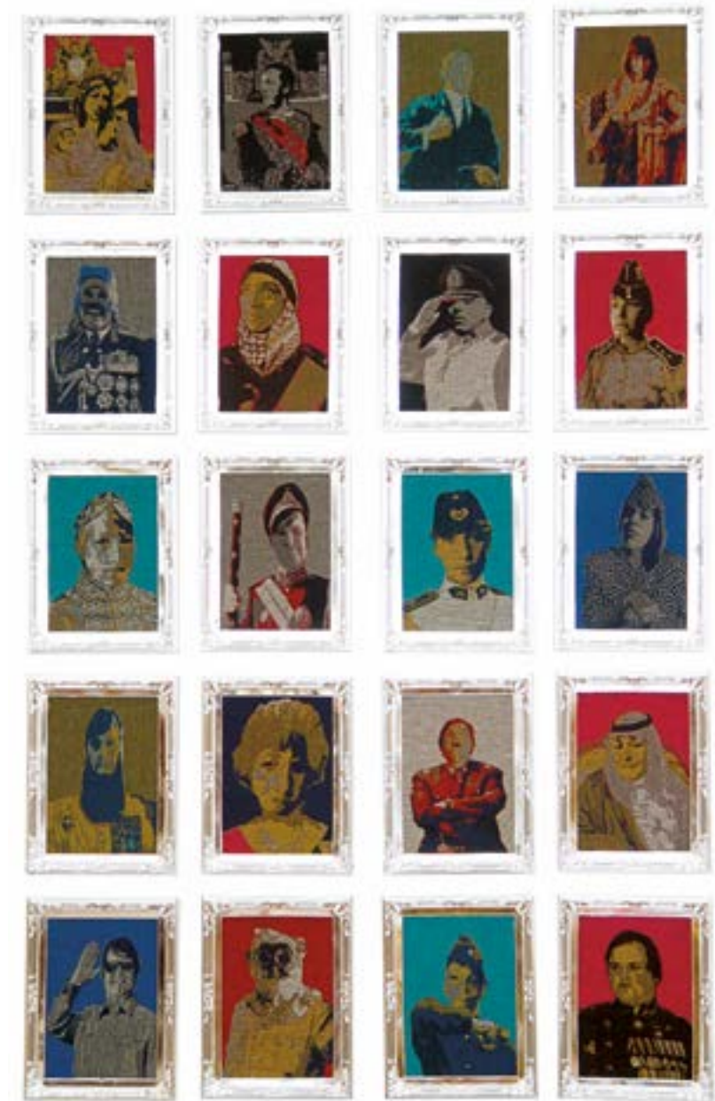
Abb. 5 Diese Ahnengalerie zeigt verschiedene Generalstabchefs von Neukingland

Die gewebten Textilien spielen im religiösen und sozialen Leben der Neukingländer eine tragende Rolle. Sie sind angefüllt mit magischer Kraft, haben Schutzfunktion gegen Unheil und Krankheit oder stellen Verbindungen zur Götter- und Ahnenwelt her. Durch die Darstellung der Ahnen in textiler Form bleibt dem Glauben nach der Neukingländer der Kontakt zu den Ahnen auf ewig erhalten.