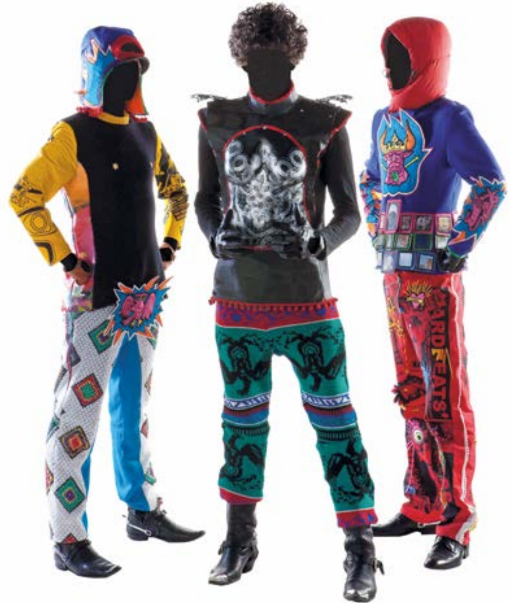
Abb. 15 Beispiel für die Trachtenuniformen der Neukingländer

Waffenrock aus ultramarinblauem Filz mit grünem Passepoil an den Ärmelenden. Auf Brust, Rücken und den Ärmeln in bunter Seide gestickte Tiermotive. Um die Taille aufgenähter Schuppengürtel, der bei Veränderung des Sichtwinkels die enthaltenen Bildmotive wechselt. Hose aus rotem Tuch, bedruckt und reich bestickt mit religiösen Motiven aus Neukingland. Am äußeren Rand der Hose befindet sich ein weißes Bommelband.