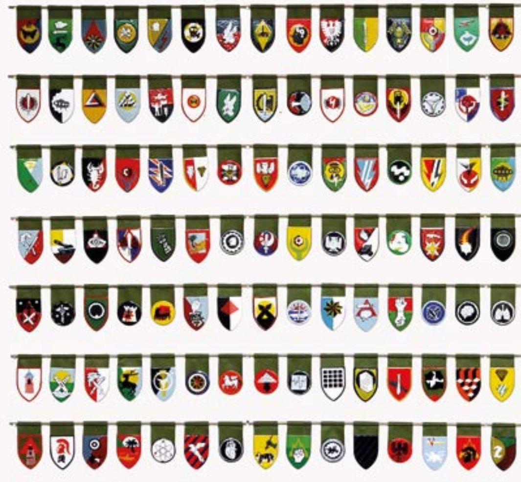
Abb. 4 105 verschiedene Abzeichen von Neukingland

Die wissenschaftliche Bearbeitung des Kriegervolkes von Neukingland erweist sich als besonders schwierig, da Gestalter und Ausführer durchweg unbekannt sind. Die hier abgebildeten Abzeichen sind kleine Embleme aus Metall. Damit sie eine lange Haltbarkeit gewährleisten, sind sie mit Emaillierung überzogen. Sie werden an der linken Schulter der Kleidung befestigt und getragen. Diese Sammlung von 105 Abzeichen zeigt einen kleinen Ausschnitt aus der Einheitenvielfalt der Neukingländer.