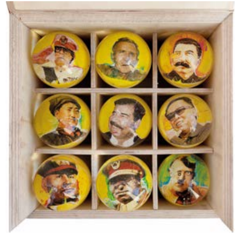
Abb. 8 Setzkasten „Tyrannen“