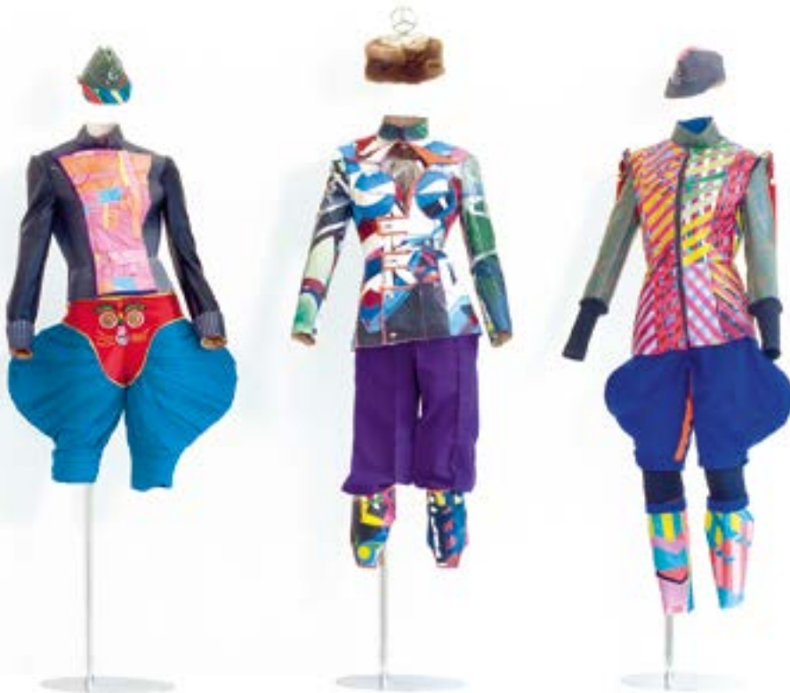
Abb. 14 Beispiel für die Frauenbekleidung im Militärbereich der Neukingländer

Die hier gezeigten Männeruniformen waren am Anfang noch Paradeuniformen, die nicht im Kampf getragen wurden, sondern nur bei festlichen Märschen. Später entwickelte sich aus diesen Paradeuniformen eine Art Tracht. Die Trachten zeigen religiöse Motive, sowie Zitate aus verschiedenen Kulturen und lassen dennoch den kriegerischen Charakter der einst getragenen Uniformen optisch wiedererkennen. Interessant hierbei ist die Verschmelzung der verschiedensten Trachtenmodelle aus den unterschiedlichen Kulturen der WoG zu einer Einheitstracht. So wurden diverse Trachten aus der Außenwelt zu einer Tracht zusammengestellt und den örtlichen Gegebenheiten angepasst. Aus den mannigfachen kulturellen Einflüssen haben die Neukingländer Kleidungschnitte, sowie vielfältige Ornamente und Muster miteinander kombiniert. Man kann deshalb hier auch von einer Volkstracht sprechen, die sich durch die verschiedenen nationalen Bindungen äußert. Das dabei entstandene Produkt ist ein Hybrid aus verschiedenen Trachten und unterschiedlichen Militäruniformen.