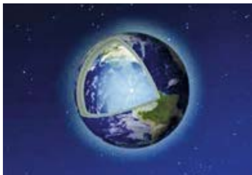
Abb. 2 Hohle Erde

Am 14. Mai 1946 rief das Land Neukingland, das eine Größe von 551.100 km 2 hat, seine Unabhängigkeitserklärung aus und gründete einen eigenen Staat. Da dieser neue Staat unantastbar für die Außenwelt war, konnten die verschiedenen Staaten (die das Projekt einst förderten) nichts gegen die Staatsgründung unternehmen und mussten die Gründung des neuen Staates anerkennen. So schien es. Die USA, die einer der Gründerstaaten der WoG war, wollte sich mit der Unabhängigkeit von Neukingland nicht abfinden.