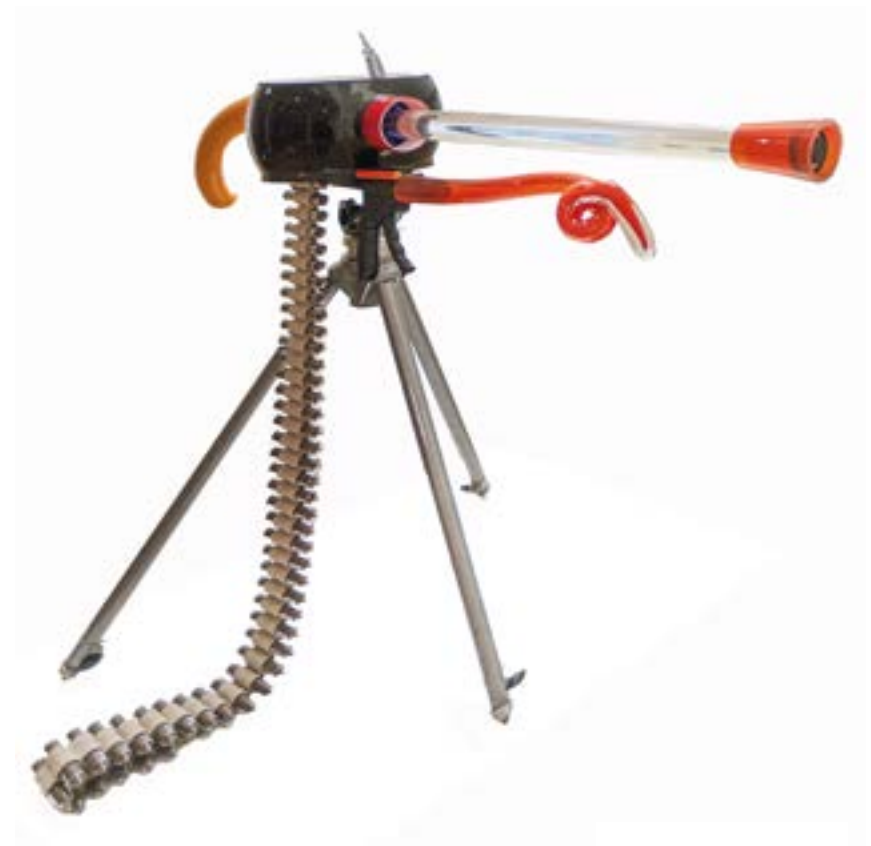
Abb. 19 Granatmaschinenwaffe Modell Adlerauge

Angesichts ihrer hohen Kadenz in Verbindung mit der Splitter- und Antipanzerwirkung der 40 mm Geschosse, vereint die Adlerauge die Vorteile von Maschinengewehr und Granatwaffe. Zudem ist die Adlerauge äußerst flexibel einzusetzen. Sie lässt sich als Infanteriewaffe auf einem Dreibein für den Erdzielbeschuss oder lafettiert auf Patrouillenbooten und militärischen Fahrzeugen anwenden. Integrierte Sicherheitseinrichtungen und durchdachte Mechanismen machen die Adlerauge zu dem was sie ist: Eine der technologisch fortgeschrittensten Granatmaschinenwaffe der Welt.