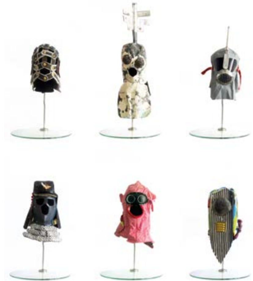
Abb.8 Zusammenstellung von verschiedenen Masken

Diese Stülpmaske wird als Kunstwerk mit besonderer Ausdrucksstärke angesehen. Wegen ihres großen netzartigen Bullauges und des kleineren goldenen Rechteckmundes, die in die große schwarz/weiß gestreifte Fläche eingefügt sind, ist sie von besonders optischem Reiz. Die Rückseite der Maske ist aus dem militärischen City-Tarn-Muster von Neukingland gefertigt. Solche Masken werden an Zäune gehängt, in der Hand gehalten, auf den Boden gelegt oder an nahezu jede Stelle des Körpers, wie auch auf dem Gesicht getragen. Aus der gewählten Trageweise ergibt sich jeweils ein anderer Aussagegehalt der Stülpmaske "HE HE".