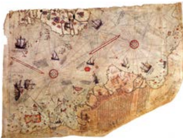
Abb. 1 Eisfreie Antarktis, Erdkarte des Piri Reis von 1513

fanden die ersehnten Geheimmanuskripte, die seltene Handschriften und Karten enthielten. Alles, was von mit okkulten Themen und geheimen Wissenschaften handelte, wurde zusammengetragen und ausgewertet. Durch das Sammeln sämtlicher alter Schriften entstand nach und nach eine beeindruckende Spezialbibliothek, die einen Umfang von 130.000 Werken zu verzeichnen hatte. Besonderen Fokus richteten die Forscher auf ein altes Manuskript, welches wichtiges Detailwissen über die Antarktis enthielt. In diesem Manuskript fanden die Forscher eine Karte (Abb. 1), die der türkische Admiral Piri Reis, zu Beginn des 16. Jahrhunderts erstellt hatte. Auf dieser Karte sind die genauen eisfreien Uferumrisse der Nordantarktis aufgezeichnet. Handschriftliche Randbemerkungen auf der Karte des Admirals besagen, dass er für die Erstellung der Karten auf Quellen zurückgegriffen hatte, die seiner Zeit bereits schon mehr als 3000 Jahre alt gewesen sein müssen. Die Wissenschaftler prüften die gefundene Reichskarte vor Ort auf ihre Richtigkeit und stellten dabei fest, dass die Karte exakter war als die bekannten Karten aus dem 20. Jahrhundert. Es stellte sich nun die Frage: wie konnte eine solche Karte, die den Uferverlauf zeigt bevor er vom Eis bedeckt wurde, im Jahre 1511 zu so genauen Ergebnissen führen? Der Admiral Piri Reis musste also tatsächlich uralte Aufzeichnungen besessen haben, von einer Zivilisation die in der Antarktis lebte, als diese noch eisfrei war.