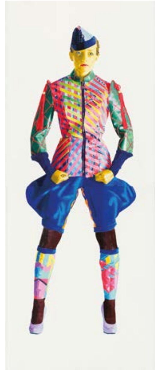
Abb. 12 General Bergfrühling 2